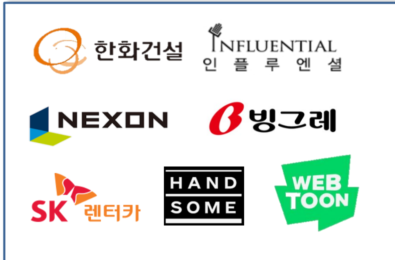
< 신규 광고주 : 본사 >